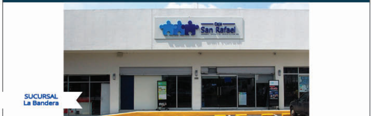
SUCURSAL La Bandera

Lunes a Viernes 8:30 a.m. a 6:00p.m. Sábado 9:30 a.m. a 1:30p.m.